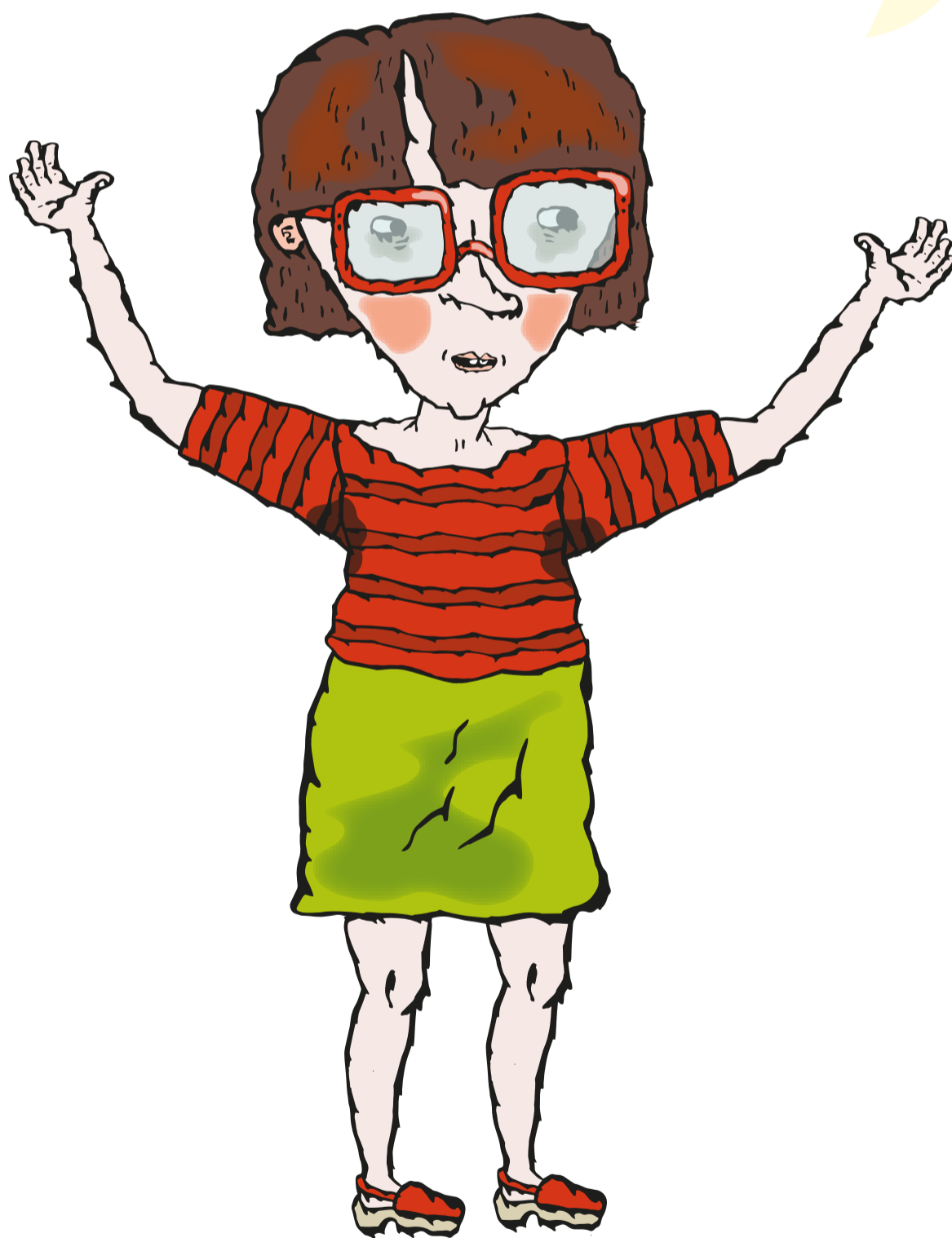
Irina Kovalenko Yrke: Optiker

Om jag har stulit juveler? Vilken fräckhet! Jag har tillräckligt att putsa, med alla glasögon här i butiken. Dessutom var jag på lunch på Café Panini & Bernard mellan ett och två, med Siv Leander. I morse var Barbro Palm här, vilken otroligt otrevlig kvinna det är! Henne borde ni titta närmare på. Vad har ni hört, säger ni? Okej, jag erkänner att jag skulle vilja flytta min gamla mamma till ett lyxigt vårdhem. Men min ekonomi räcker tyvärr inte till.