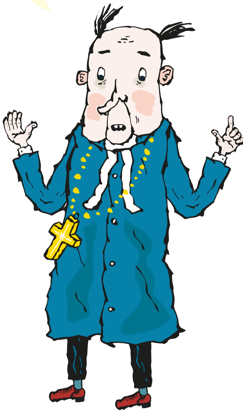
Prästen Yrke: Präst

Folk går inte längre i kyrkan som förr, det är så tråkigt. De bryr sig bara om onödig lyx, som Ivy Roos som vill ge sin hund ett diamanthalsband! I går klockan ett var jag på Superlivs och köpte kyrkkaffe av Veronika och jag valde noga. Det tog kanske en timme, kaffet måste vara gott!